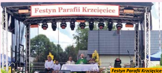
Festyn Parafii Krzęcice