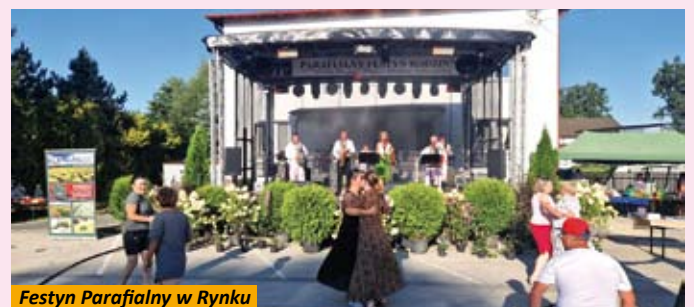
Festyn Parafialny w Rynku