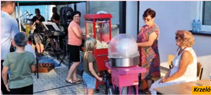
Krzelów - Czekaj